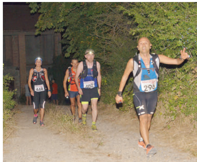
Un momento della gara. In alto, il podio maschile